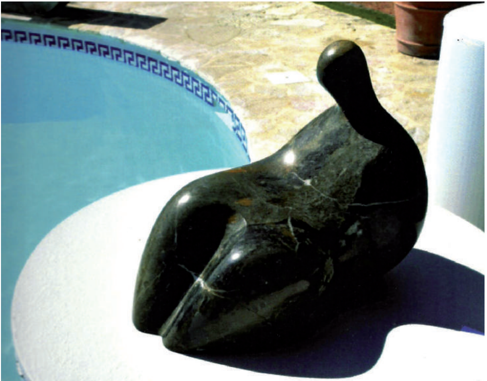
Alexandru Paraschiv - Repaus II sculptură în piatră