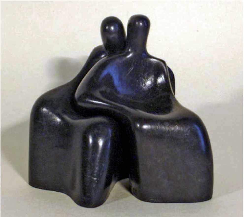
Alexandru Paraschiv - Cuplu I sculptură în piatră