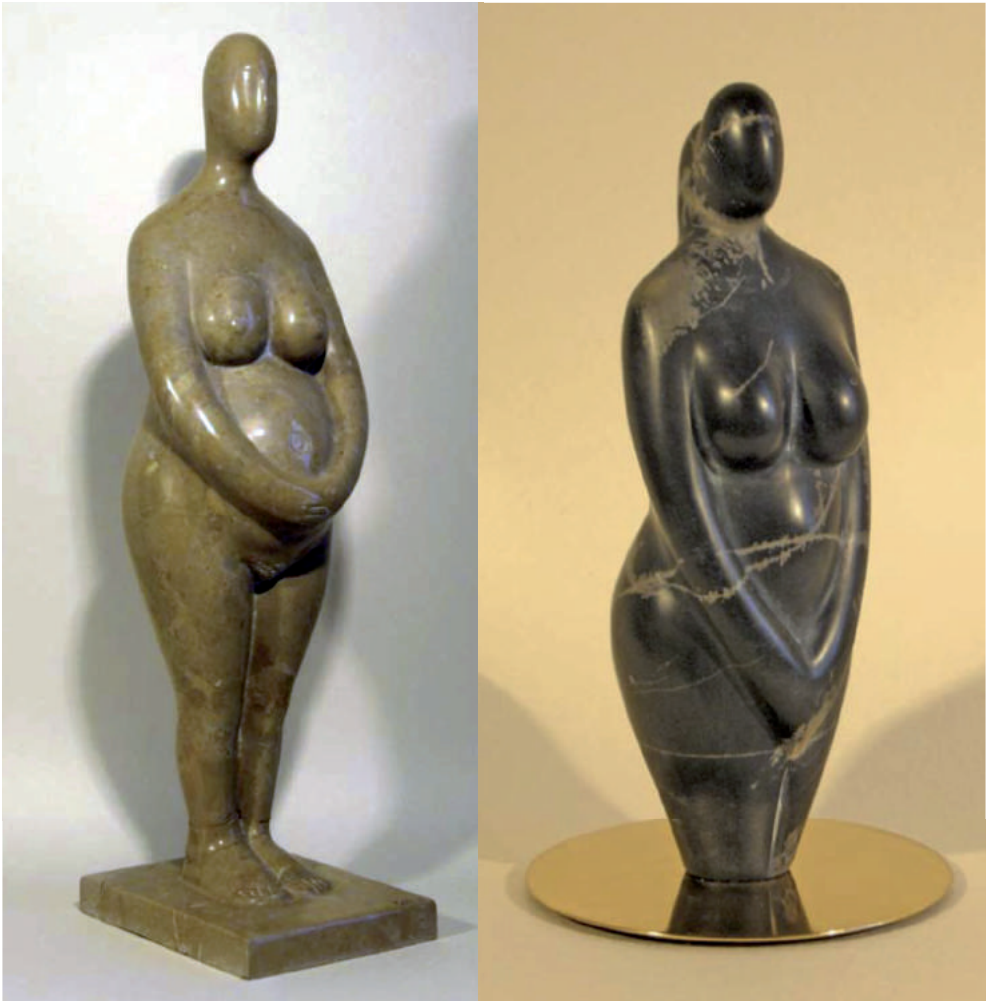
Alexandru Paraschiv - Maternitate I, II sculpturi în piatră