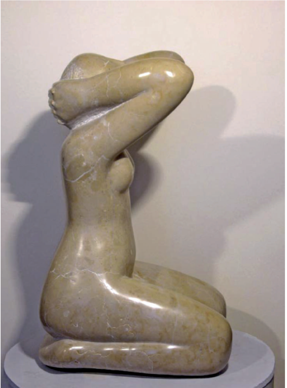
Alexandru Paraschiv - Meditație sculptură în piatră