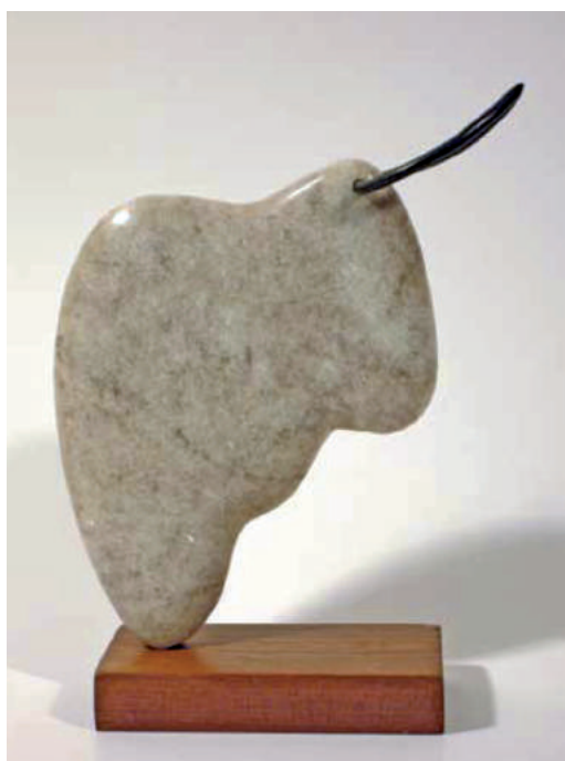
Alexandru Paraschiv - Cap de taur sculptură în marmură