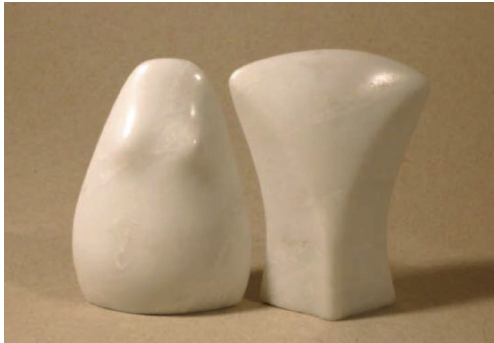
Alexandru Paraschiv - Torsuri sculpturi în marmură