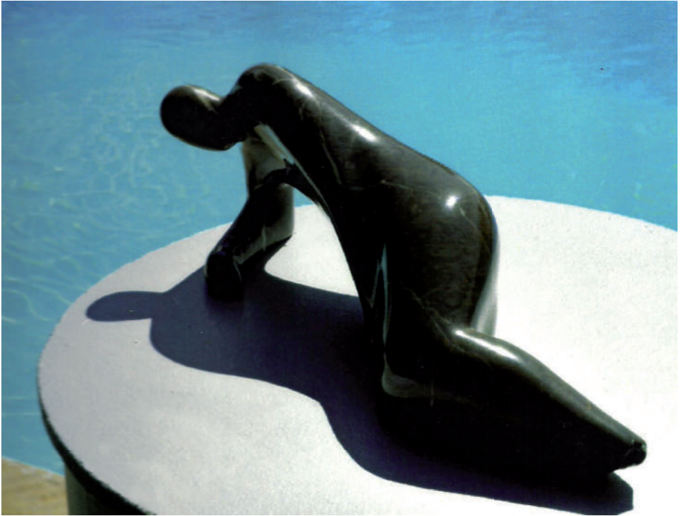
Alexandru Paraschiv - Repaus I sculptură în piatră