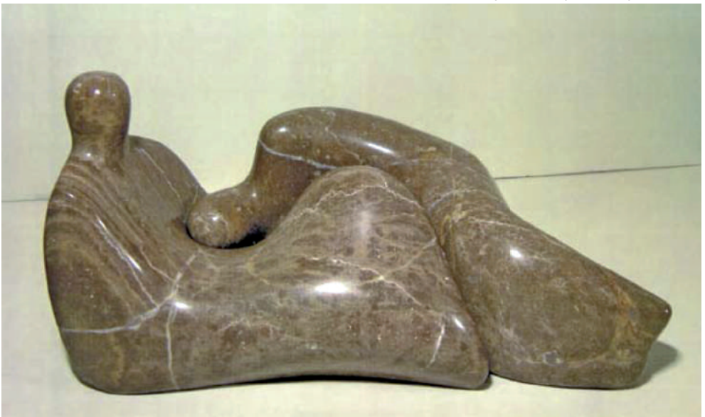
Alexandru Paraschiv - Cuplu II sculptură în piatră