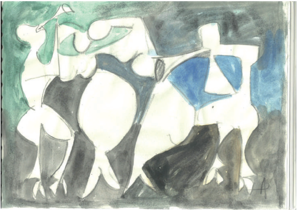
Alexandru Paraschiv - Muzicanți pictură